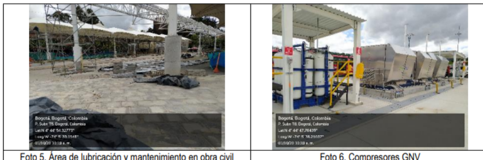
Foto 5. Área de lubricación y mantenimiento en obra civil